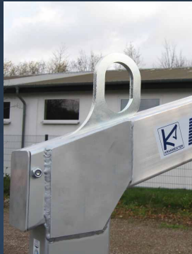
Einfaches Einhängen des Kranhakens