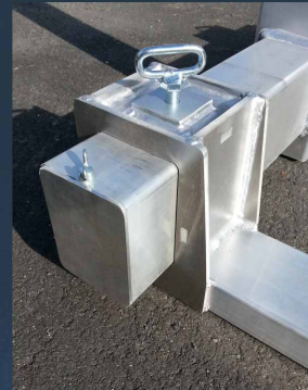
Verstellbare Gabelzinken, speziell geschweißte Profile für hohe Belastbarkeit