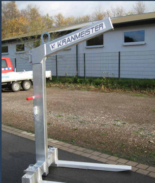
Automatischer Gewichts- ausgleich und wartungsfreies Druckfedersystem