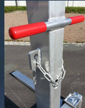
Praxisorientiert - gute Funktionalität und Handhabung